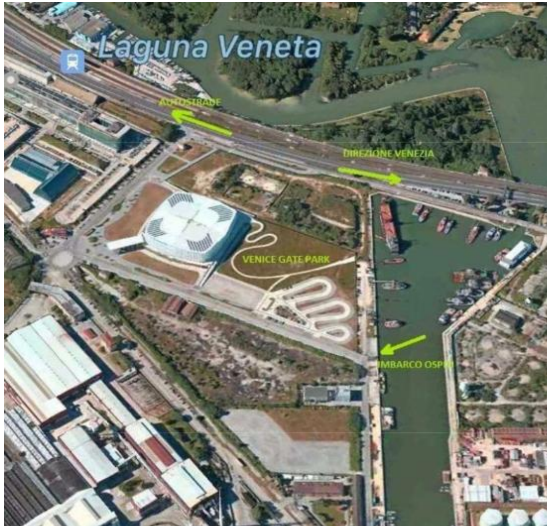
VENICE GATE PARKING - Via Galileo Ferraris

Tramite Autostrada A1 fino a Bologna poi in A13 Bologna - Padova e infine in A4 Padova - Venezia.